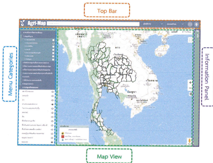
ภาพที่ 3 : แสดงหน้าจอหลักของระบบ Agri-Map Online